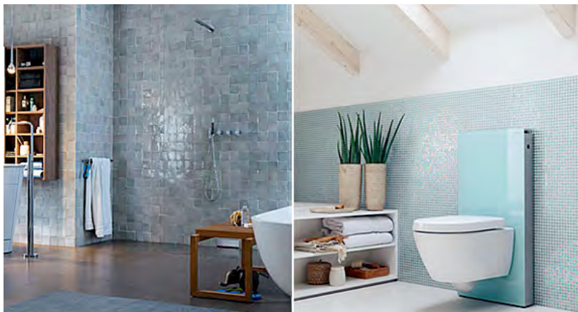
Marktführer Geberit eruiert in Expertise die wichtigsten Badezimmer-Trends

Störende Zu- und Abläufe, mangelnde Be- und Entlüftungsmöglichkeiten, schlechte Raumaufteilung, in die Jahre gekommenes Design – das Badezimmer führt in den meisten Häusern und Wohnungen derzeit ein unscheinbares Dasein. Doch: Der Trend weist eindeutig in eine andere Richtung. 0 Kommentare